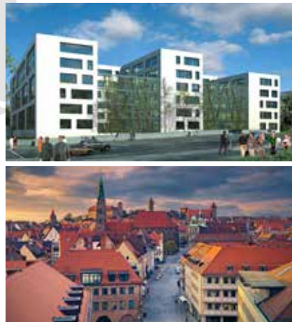
Objekt „Frankencampus“, Nürnberg

Gestreute Lagen Gestreute Mietvertragslaufzeiten Mietermix Gestreute Branchen Zeitgemäße Gebäude