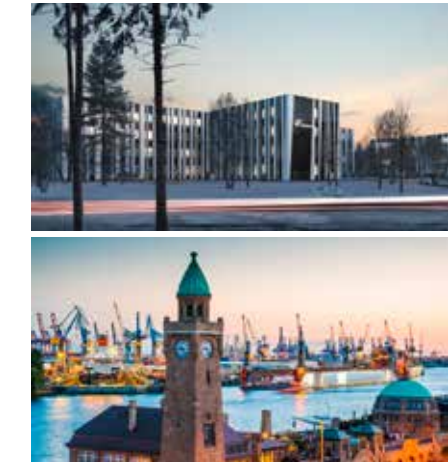
Objekt „Nordex“, Hamburg-Langenhorn